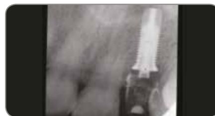
Abb. 6 Es wurde eine periapikale Röntgenaufnahme der provisorischen Restauration gemacht.