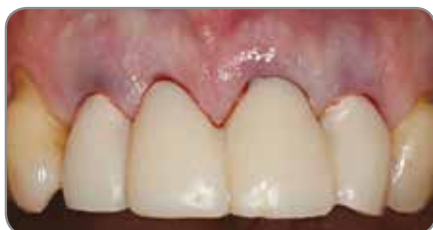
Abb. 4 Eine provisorische Restauration wurde am Behandlungsstuhl mit einer transparenten Schablone und Protemp™ 4 Garant™ (3M ESPE) hergestellt.