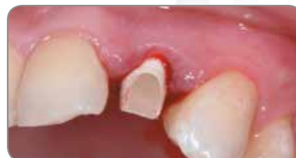
Abb. 3 Der PreFormance Pfosten wurde intraoral nach dem Verlauf der Gingivakonturen präpariert.