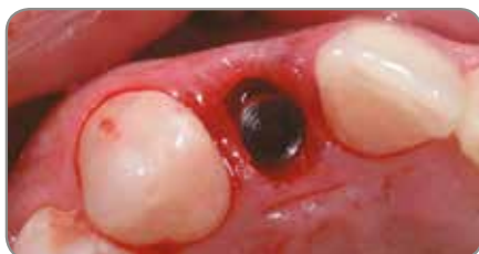
Abb. 1 NanoTite® Certain Implant nach der Insertion. Der Knochen wurde um die Verbindungsfläche konturiert.