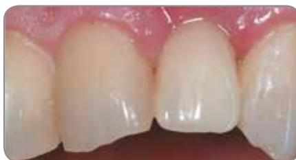
Abb. 5 Die provisorische Restauration wurde hergestellt und nach Überprüfung und Korrektur der okklusalen und approximalen Kontakte am Patienten eingegliedert.