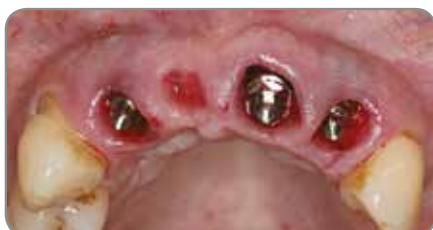
Abb. 1 Konische verschraubte Abutments wurden mit 20 Ncm eingesetzt.