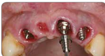
Abb. 2 QuickBridge Titanzylinder wurden eingesetzt.