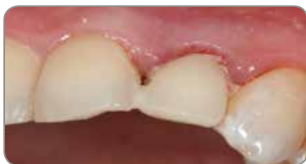
Abb. 4 Die vorgefertigte Krone wurde auf den PreFormance Pfosten geklebt.