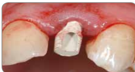
Abb. 2 Ein PreFormance Pfosten wurde in das Implantat gesetzt.