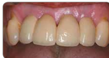
Abb. 6 Eine BellaTek® kopiergefräste definitive Brücke wurde hergestellt und eingesetzt.