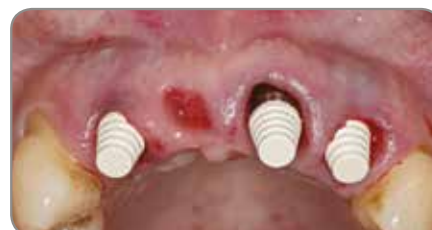
Abb. 3 QuickBridge PEEK-Kappen wurden mit Einrasten auf die Titan-Zylinder gesetzt.