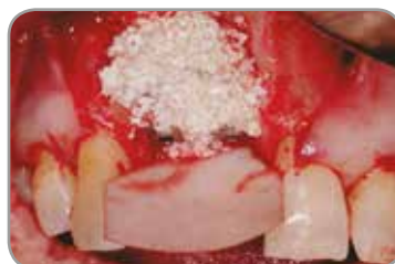
Fig. 11 : Greffe avec les petits granules pour xéno greffe Endobon, recouverte d'une membrane résorbable en collagène OsseoGuard.