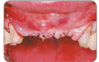
Fig. 3 : Les lambeaux de tissus mous ont été refermés, puis suturés.