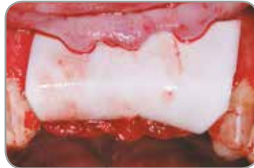
Fig. 2 : Greffe avec les petits granules pour xéno greffe Endobon, recouverte d'une membrane résorbable en collagène OsseoGuard.