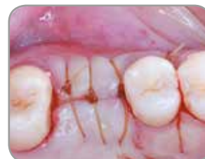
Fig. 9 : L'implant est resté enfoui pendant les deux mois de cicatrisation.