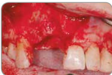
Fig. 7 : Anomalies après l'extraction au niveau des incisives latérales et centrales du maxillaire droit.