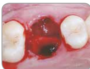
Fig. 1 : Site d'extraction de la première molaire du maxillaire.

Fabricant : Collagen Matrix, Inc., Oakland, NJ