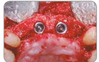
Fig. 6 : Vue occlusale après quatre mois.