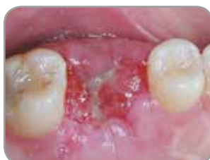
Fig. 4 : La cicatrisation progresse sans problème. Les tissus mous se sont épithélialisés sur la membrane OsseoGuard Flex deux semaines après l'intervention chirurgicale.