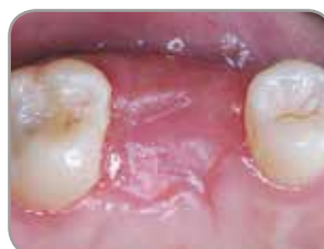
Fig. 5 : Le site a été entièrement recouvert quatre semaines après l'extraction.