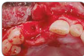
Fig. 8 : Vue occlusale des anomalies du site d'extraction.