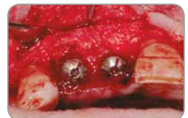
Fig. 12 : Régénération quatre mois après le retrait des résidus de membrane.