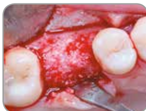
Fig. 7 : Quatre mois après l'intervention chirurgicale, le site est cicatrisé et prêt pour la pose de l'implant.