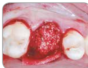
Fig. 2 : Site d'extraction greffé avec les petits granules pour xénogreffe Endobon et recouvert d'une membrane OsseoGuard Flex.