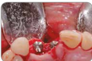
Fig. 10 : Vue occlusale des implants et anomalies.