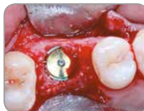
Fig. 8 : Un implant Zimmer Biomet Dental de 6 mm de diamètre et doté d'une plate-forme de 5 mm a été posé quatre mois après l'intervention chirurgicale.