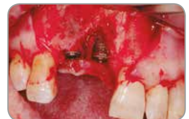
Fig. 9 : Vue faciale des défauts de déhiscence après la pose d'implant.