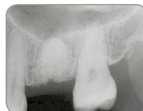
Fig. 6 : Une radiographie du site de greffe réalisée quatre mois après l'intervention chirurgicale révèle une excellente tenue du matériau de greffe.