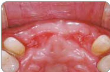
Fig. 4 : Aspect clinique des tissus mous montrant une excellente cicatrisation après quatre mois.