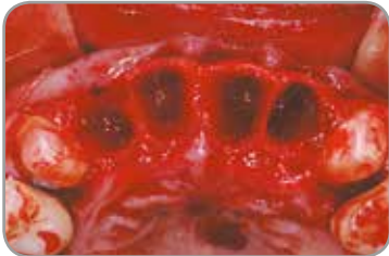
Fig. 1 : Sites d'extraction des quatre incisives du maxillaire et pose d'implant immédiate.