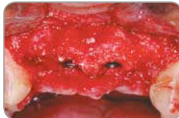
Fig. 5 : Aspect clinique du site régénéré quatre mois après le retrait des résidus de membrane.