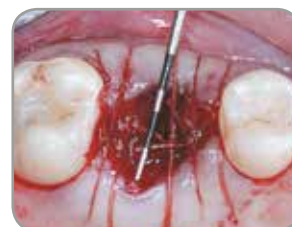
Fig. 3 : Les arêtes de la membrane ont été placées sous les tissus mous et fixées par des sutures résorbables.