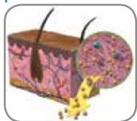
1. Tratamiento alcalino

Los tejidos procesados con Tutoplast se han usado con seguridad en más de cinco millones de procedimientos en los últimos cuarenta años. 4