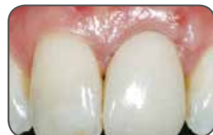
Figura D 30 días después de la operación. Observe el buen resultado estético en cuanto a uniformidad y color.

Los resultados individuales podrían variar.