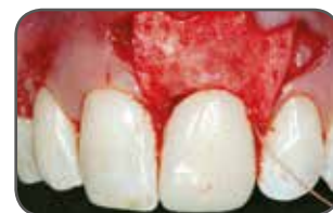
Figura B Colocación quirúrgica de matriz de tejido dérmico Puros para aloinjerto.