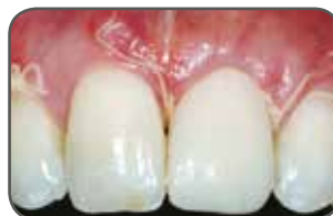
Figura C 10 días después de la operación. Observe la excelente integración del tejido blando.