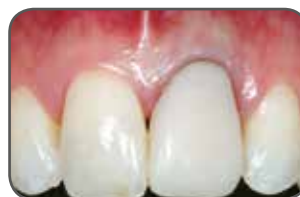
Figura A Antes de la operación: vista clínica.