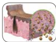
2. Tratamiento osmótico